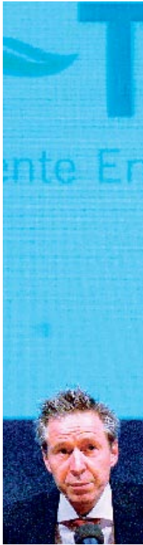
Blue-Tech-Initiator Ch. Huggenberg.