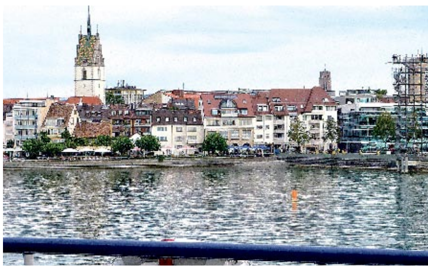
Friedrichshafen ist in Sicht, die Fähre läuft bald ein.

Friedrichshafen: Eine Spur Ferienstimmung kommt auf, wenn man in Romanshorn am Hafen steht und wartet, bis die Autofähre angelegt hat. Die «Romanshorn» und die «Friedrichshafen» verbinden stündlich die beiden Städte. Für die rund zwölf Kilometer benötigen die Schiffe 41 Minuten. Im obersten Stock des Schiffes befindet sich ein Restaurant. Ein Herbsttag eignet sich vorzüglich, um in Friedrichshafen vom Landeplatz der Fähre Richtung Stadtgarten und Schloss zu schlendern, und dabei in die benachbarten Gassen zu blicken. Immer wieder trifft man auf 50 blaue Tafeln, die zum Geschichtspfad