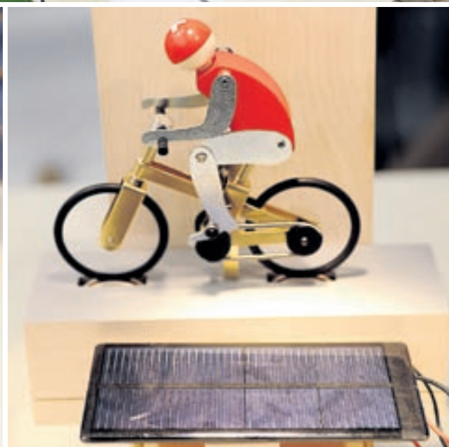
Kampf um jedes Watt und jeden Sonnenstrahl: An der Blue-Tech dreht sich alles um die Gewinnung von Energie.