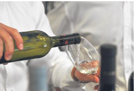
Degustation: Donnerstag bis Freitag.