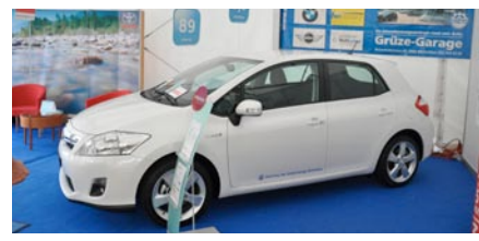
Stand der Emil Frey AG, Grüze-Garage.