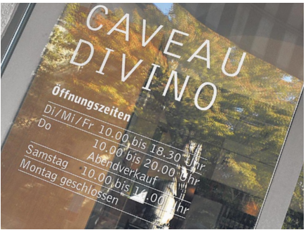
Seit Samstag gibts das Gros der Divino-Produkte an der Schaffhauserstrasse 6.